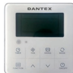
Проводной пульт управления UA-MWR5 (опция)

RKD-CHANI/RKD-HANIE-W включает устройства с мощностью охлаждения от 5,28 до 16,12 кВт.