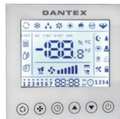
Проводной пульт управления KW-86J2 (опция)

RK-CHT3N/RK-HT3NE-W включает устройства с мощностью охлаждения от 5,3 до 16,12 кВт.